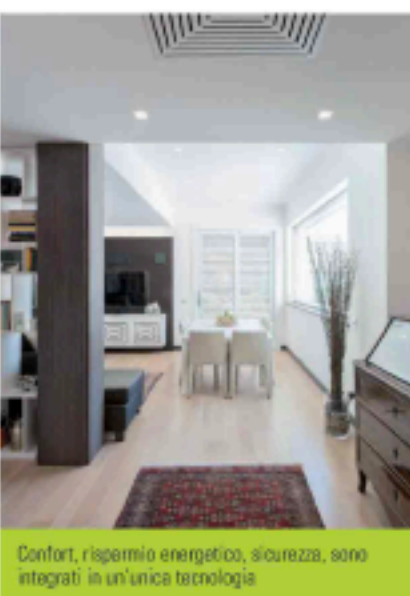
Comfort, risparmio energetico, sicurezza, sono integrati in un'unica tecnologia

stanza per stanza, e del terrazzo con piscina, oltre ad attivare l'irrigazione esterna, scegliere il brano musicale che si vuole ascoltare tramite la diffusione sonora o richiamare scenari ed eventi precedentemente impostati. Mediante i comandi domotici è così possibile controllare localmente sia le automazioni che le luci, che risultano posizionate in modo da evidenziare le sagome degli arredi e da illuminare, con giochi di effetto, i particolari architettonici della residenza.